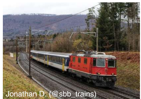
Jonathan D. (@sbb_trains)